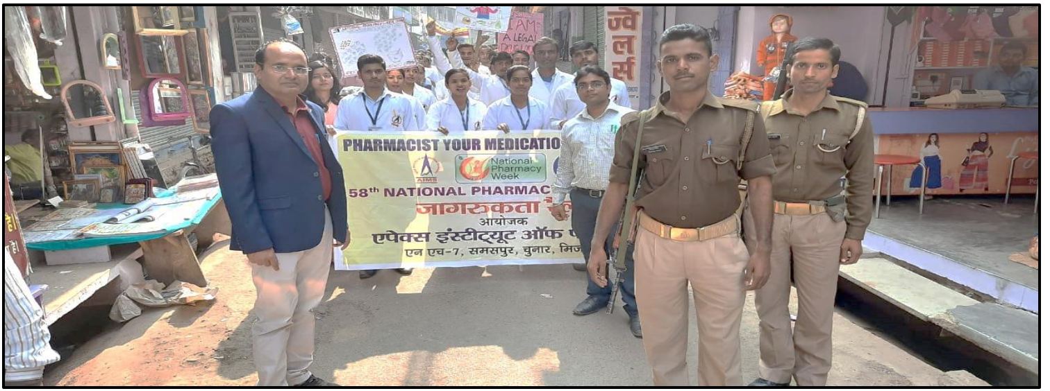
चुनार बाजार में हेल्थ के प्रति जागरूक करते हुए छात्र/छात्राएं