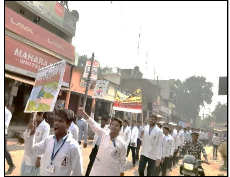
छात्रों ने प्ले कार्ड एवं स्लोगन के माध्यम से रामलीला मैदान में उपस्थित लोगों को अच्छे स्वास्थ्य के लिए प्रेरित किया